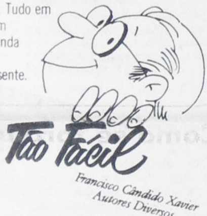
Francisco Cândido Xavier Autores Diversos