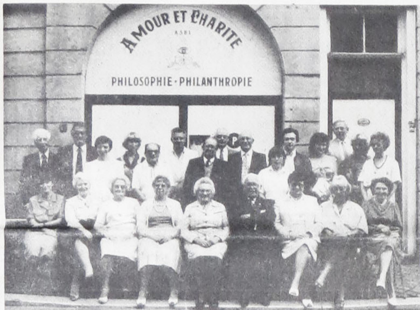
O Grupo Espírita «Amour et Charité», de Liège, Bélgica, nos enviou esta expressiva fotografia com seu Conselho Diretor em frente à sede da entidade. A legenda que acompanha a foto com votos de felicidades para 1988 é bem expressiva: «Que a expansão do Espiritismo continue sendo nesse objetivo comum e que reine entre nós uma fraternidade a toda prova».