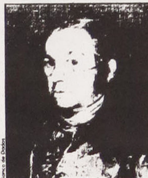
Auto-retrato, de Francisco Goya