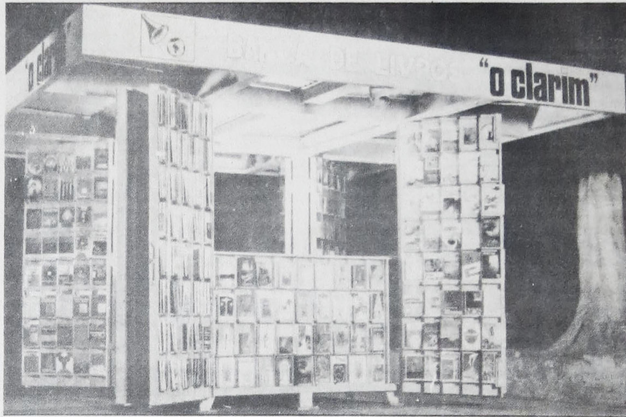
A Modelar Banca de Livros «O Clarim» com suas oito portas abertas, vendo-se um balcão fechando três lados da banca, e na face externa do balcão, compartimentos para exposição de livros.