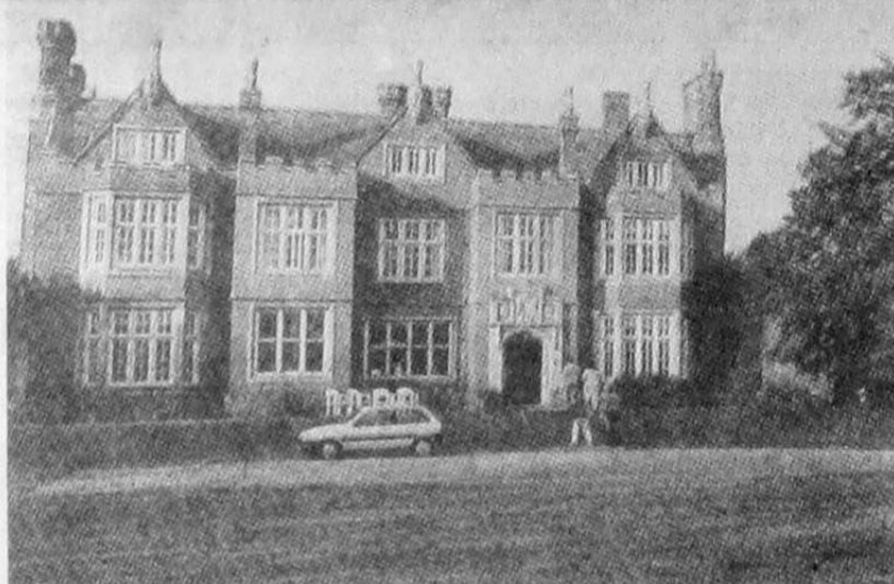
Na Clínica do Dr. Edwards, a esperança de casais do mundo todo