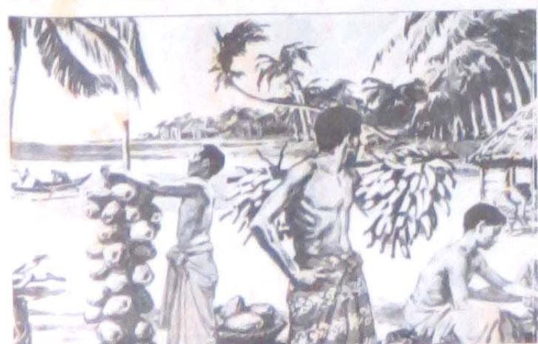
FAA-NUI, ilha do além tem paisagem semelhante a essa