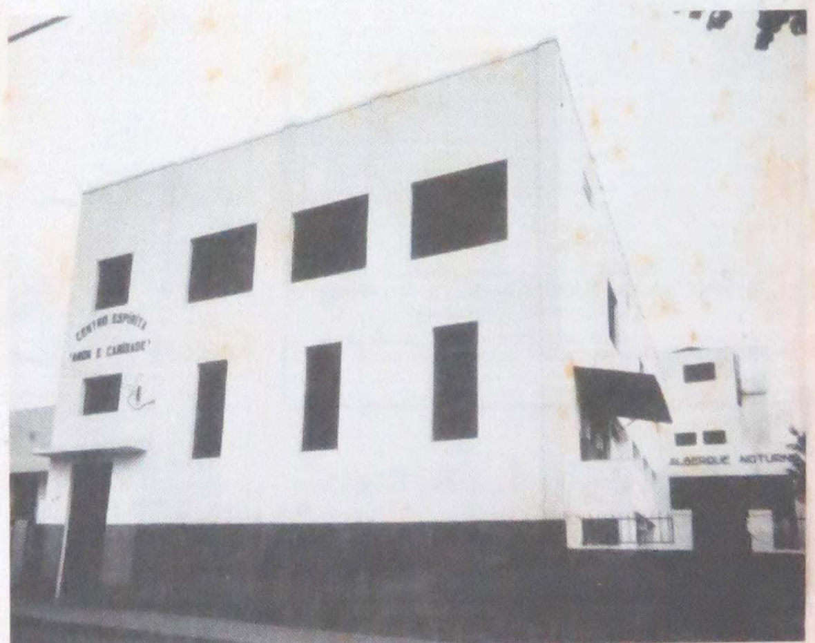
C.E. "Amor e Caridade": atendeu 13.860 pessoas em 95 com 24.881 refeições; 19.647 lanches; 18.497 peças de roupa; 3.369 passes para viagem

Esclarecidos pelos Espíritos Superiores de que numa sociedade organizada segundo a lei do Cristo, ninguém deve morrer de fome e de que quando o homem praticar a lei de Deus, terá uma ordem social fundada sobre a justiça e a solidariedade, os espíritas do Brasil, independentemente da ação governamental, têm procurado minorar a fome de seus compatriotas. Em Bauru, como em outras cidades brasileiras, isso pode ser constatado. Foi o que apurou a reportagem do jornal de Bauru. (Pág. 3)