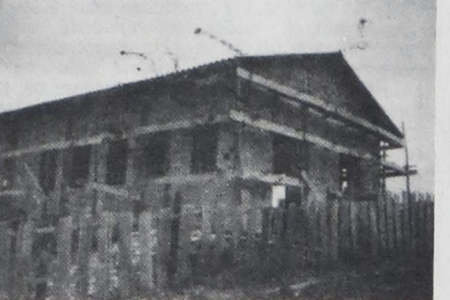
O Centro Espírita Fraternidade nasceu como o arbusto novo, frágil... Teve sua base implantada... paredes levantadas... seu teto completado... E, finalmente, a árvore crescida e frondosa.

Anoto estas frases porque, às vezes, surgem jovens com ideais políticos em nosso movimento. Com seu coração generoso, eles não se conformam com a corrupção administrativa. Insurgem contra este estado de coisas! Cumpra então advertir que, o Espiritismo em si mesmo a NÃO SE ENVOLVE EM QUESTÕES PARTIDÁRIAS. Sua missão é inteiramente de outra ordem. Mas isto não invalida a possibilidade de um espírita (caso queira) se enverede pela política e lá seja um exemplo de trabalhador intrépido em prol do bem comum, agindo de modo que todos tenhamos melhor condição de vida, num mundo onde ainda impera tanto egoísmo e tanto desamor porque não são devidamente observadas as Leis de Deus.