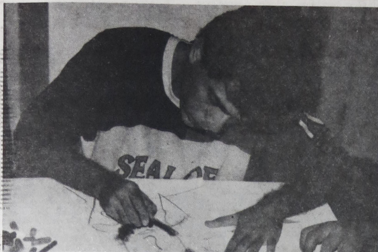
O espírito Renoir desenha o rosto do espírito Ambroise Parré, médico que teria tido destacada participação na terrível Noite de São Bartolomeu, onde centenas de huguenotes foram massacrados.