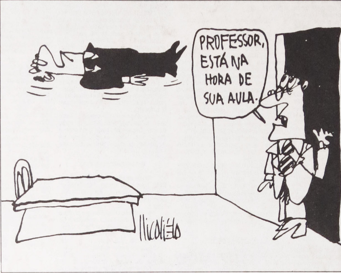
Charge da "Folha da Tarde", de São Paulo, quando noticiou a aceitação da Parapsicologia na Universidade de Edimburgo, na Inglaterra.