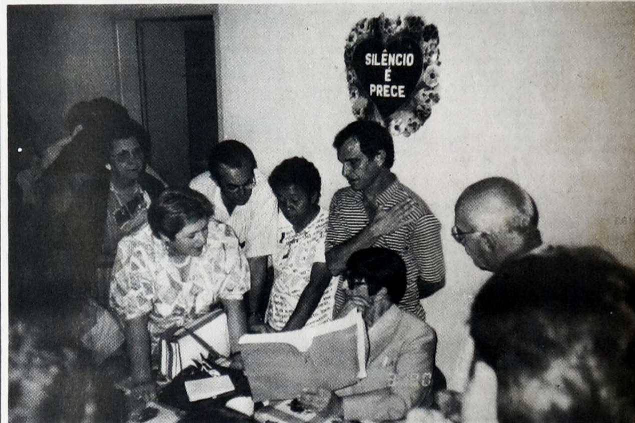
Conclusão da pag. 1

FE: O que é que os espíritos têm dito a respeito da transcomunicação? Na Europa, hoje,