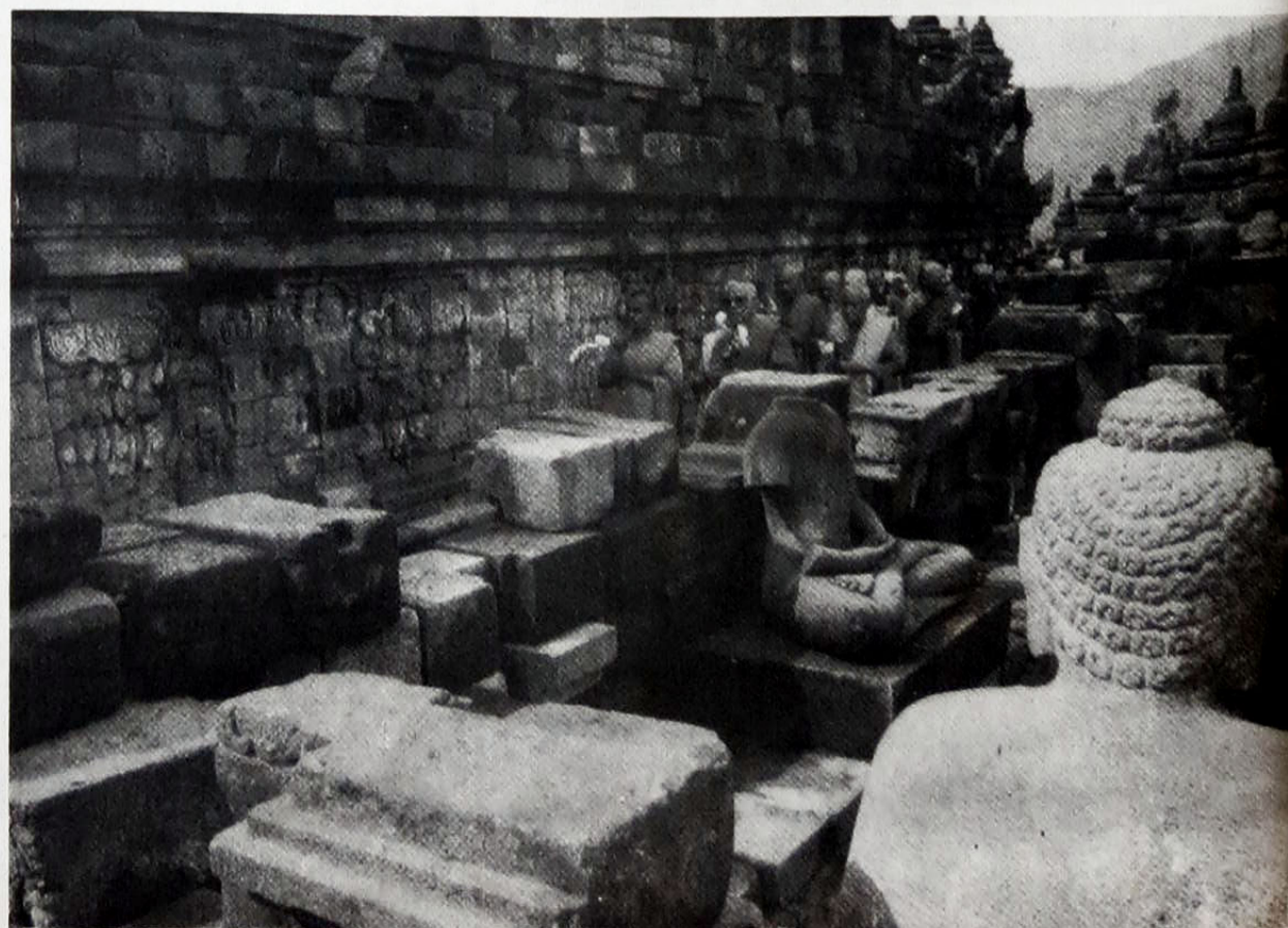
Celebração Budista no Templo Central, em Java, Indonésia

CAIO SALAMA DIVULGAÇÃO DOUtrinária NO ORIENTE: