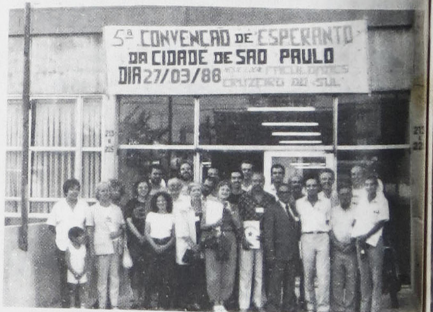
Grupo de convençionais diante do local do evento Texto na pg. 5