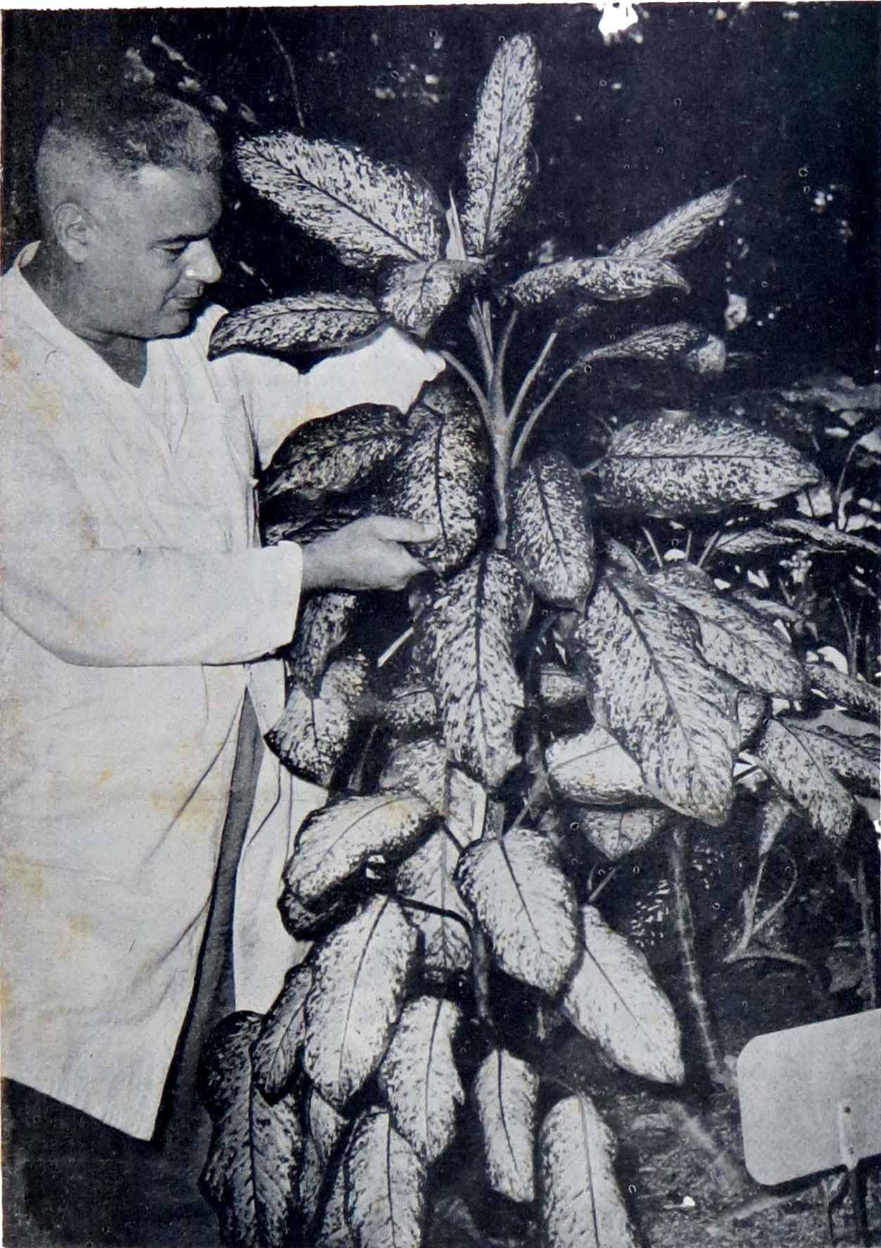
O cientista Carlos Toledo Rizzini no Jardim Botânico do Rio