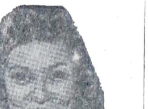
A filha curada pelo médium

Conta Fricker que sua primeira cura foi praticada em sua própria filha que tinha as mãos cobertas de verrugas.