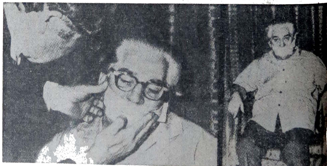
LESLIE FLINT — médium de voz direta sendo testado em Londres

A novela baseada em "E a Vida Continua" será adaptada por Ivani Ribeiro para o horário das 20 horas na Televisão Tupi, Canal 4, de São Paulo.