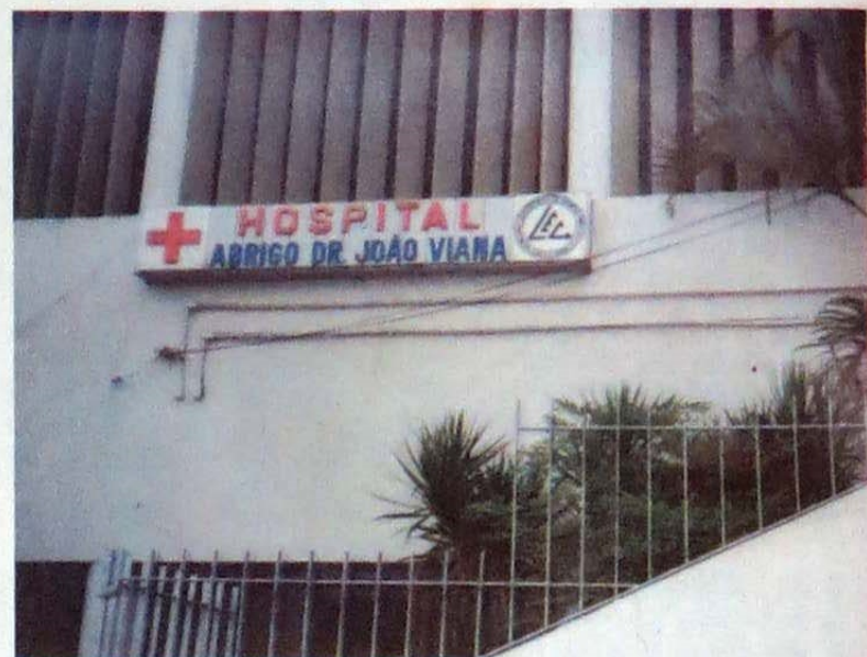
Fachada do Hospital Abrigo Dr. João Viana

Antes de abrir para o público em geral, no dia 11 de abril de 1997, a Padaria Nossa (nome escolhido pelos pacientes) só servia aos funcionários e internos. Tornando-se comercial, ela tem auxiliado na captação de recursos, colaborando para a manutenção do Hospital, além de doar pão para a comunidade carente. Só no ano passado, foram distribuídos 153.652 pães para entidades assistenciais diversas.