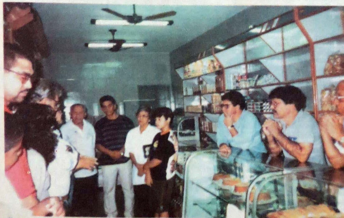
Padaria Nossa (inauguração)

A cidade de Campos dos Goytacases, no Estado do Rio, situada à beira do velho Paraíba, é uma colmeia de trabalho espiritual, embalada por doces e amenas aragens. Há 68 anos os espíritas deixam suas marcas do ideal cristão em sua atmosfera espiritual.