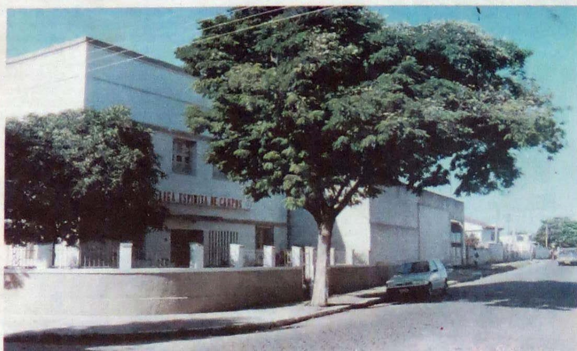
Fachada principal da Liga Espírita de Campos