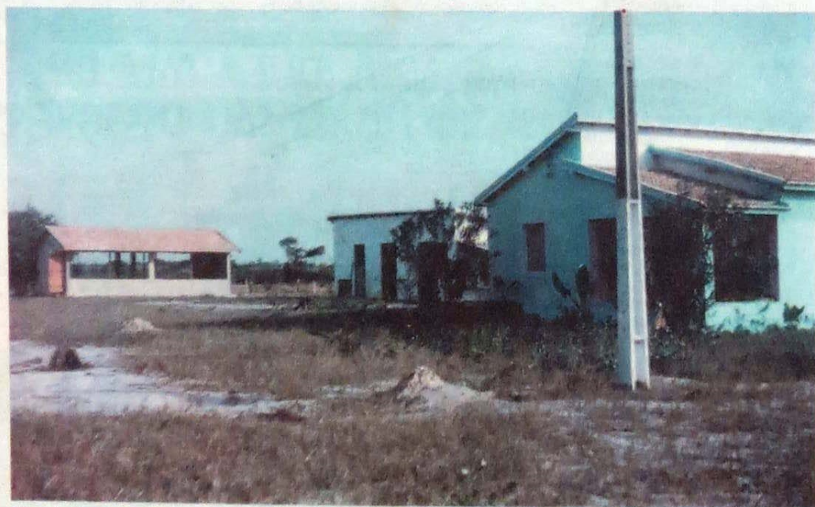
Granja da Fraternidade