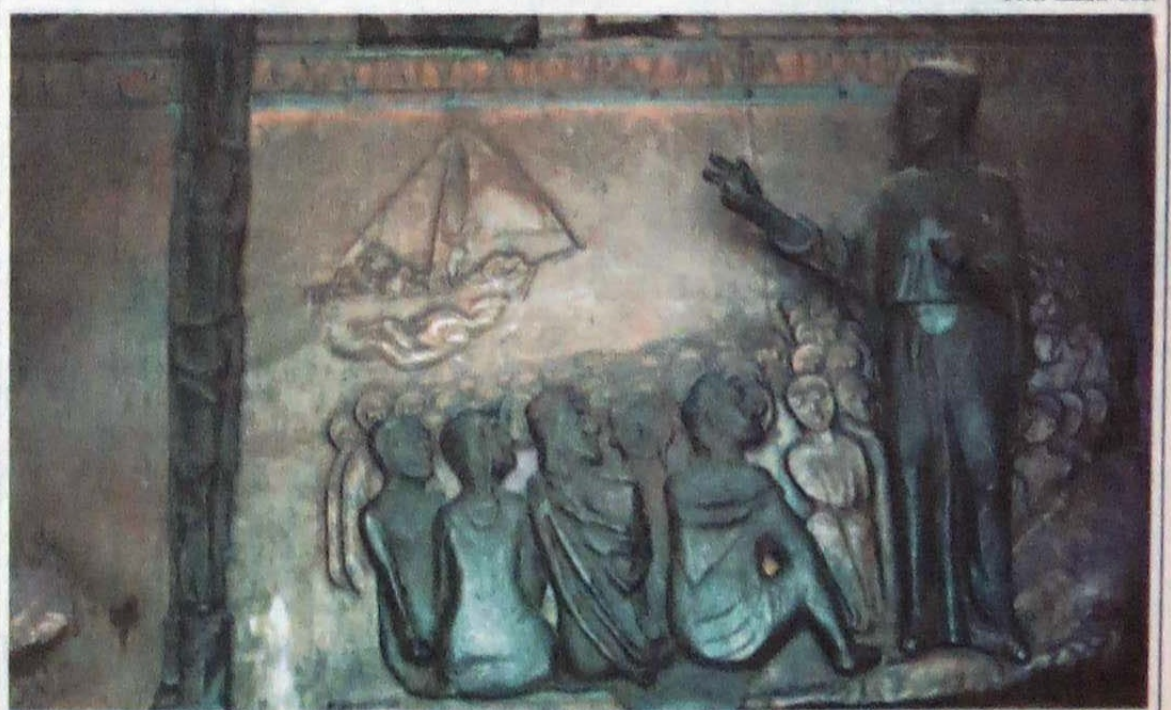
Jesus tranquilizou seus seguidores prometendo a vinda de um Consolidador que restabeleceria a verdade e anunciaria muitas outras coisas. Cena de pregação de Jesus. Detalhe da porta de ingresso da Basílica de Nazaré, Israel.