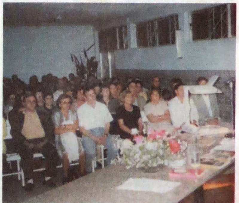
Parte do auditório da Associação Luz no Caminho (Braga)