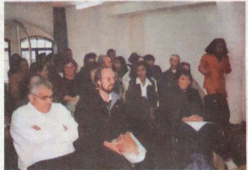
Círculo de Amigos de Allan Kardec (Colônia)