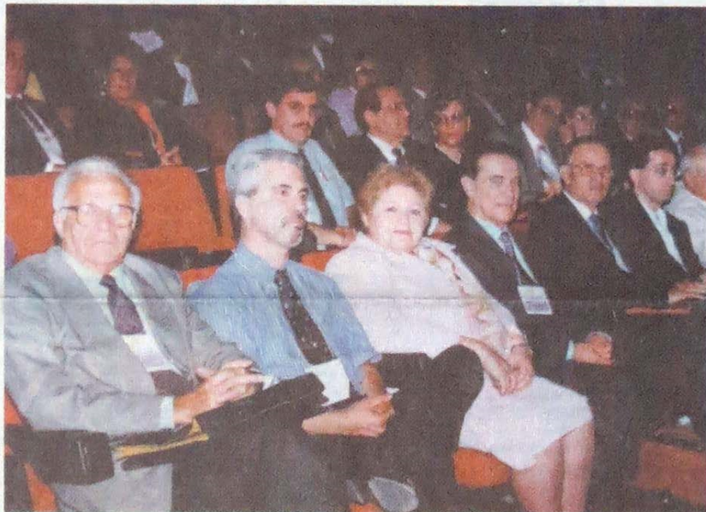
Solenidade de abertura: conferencistas aguardam o início da cerimônia