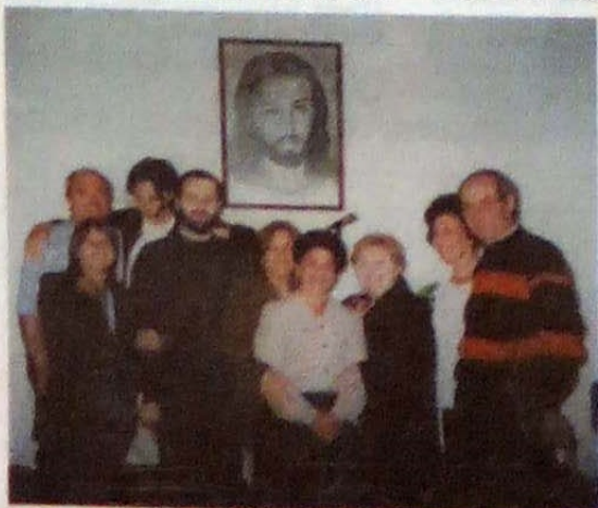
Associação Nosso Lar (Aveiro)