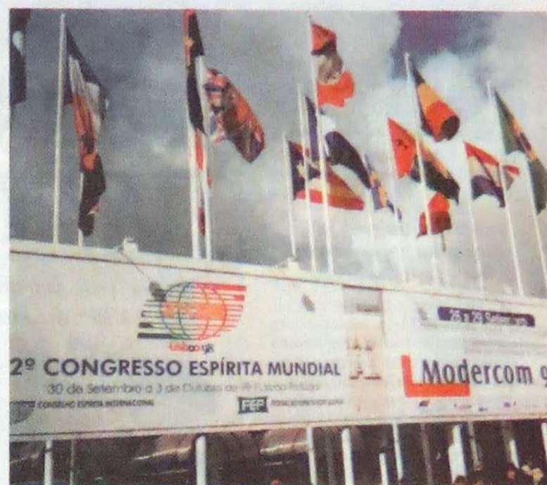
Entrada da FIL, onde foi realizado o Congresso