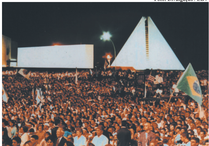
Público comemora a chegada do Ano Novo em Brasília