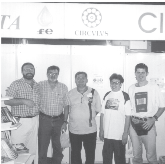
Folha Espírita Editora e Circulus estiveram presentes na Feira do Livro Espírita, realizada em João Pessoa, na Paraíba, de 7 a 12 de dezembro