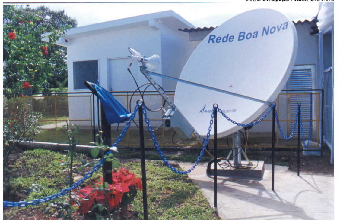
Parte do sistema de up-link para conexão com a Embratel