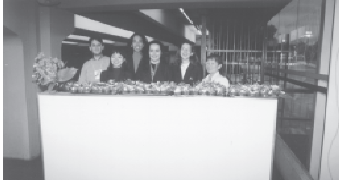
Os queridos amigos da Igreja Messiânica do Brasil com os 800 enfeites oferecidos a todos os participantes