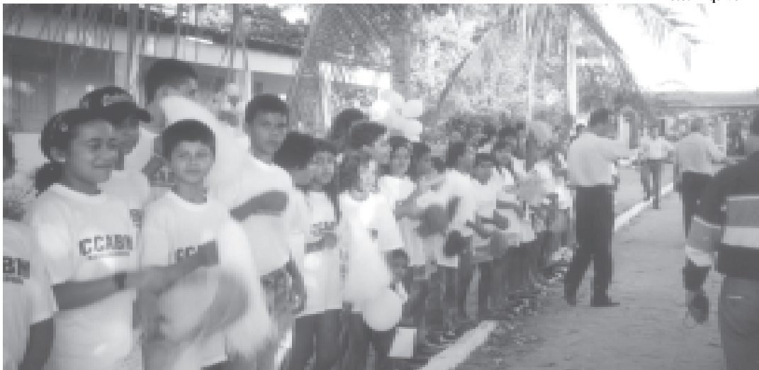
Crianças assistidas pela Casa de Caridade Bezerra de Menezes