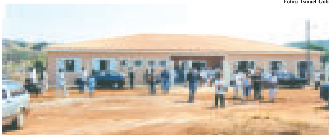
A Casa Assistencial inaugurada - Fachada principal