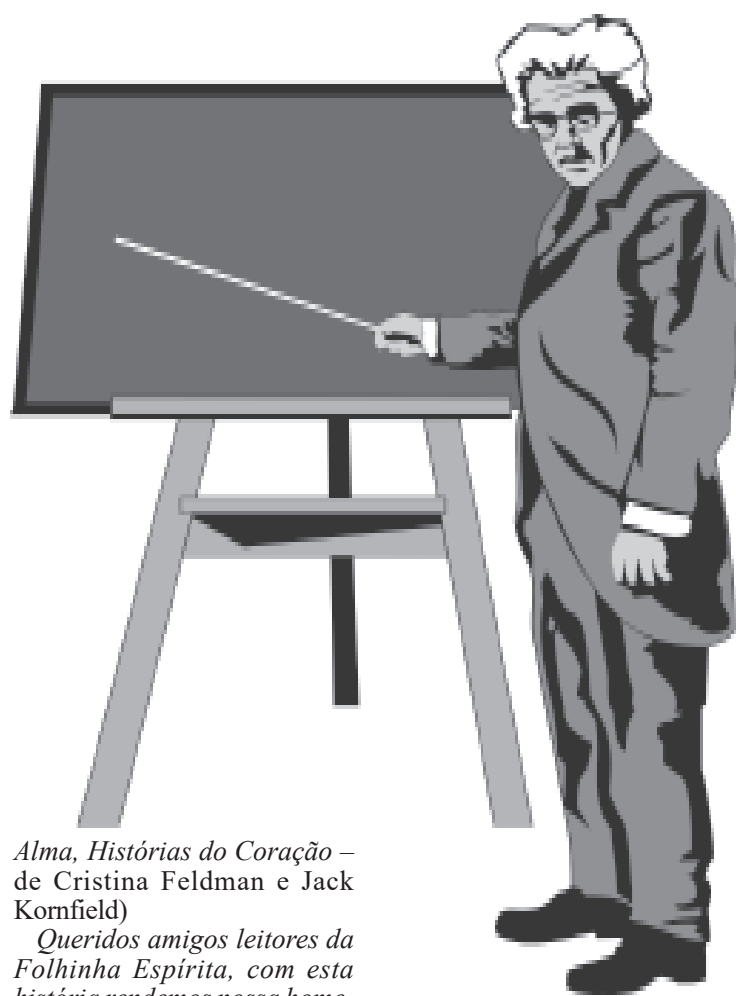
Alma, Histórias do Coração - de Cristina Feldman e Jack Kornfield

"A água encontrou seu Mestre e enrubescceu". (Extraído de Histórias da