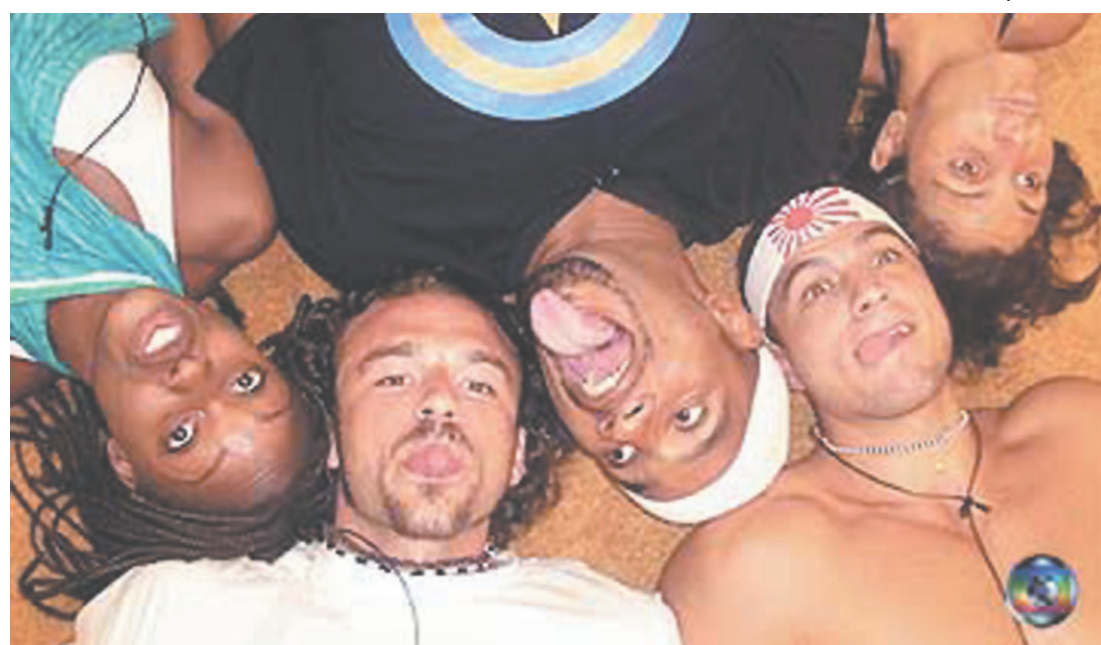
Participantes do Big Brother Brasil