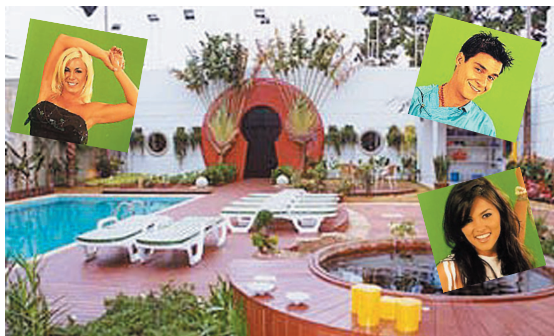
A Casa dos Artistas, artistas expondo sua intimidade para o público