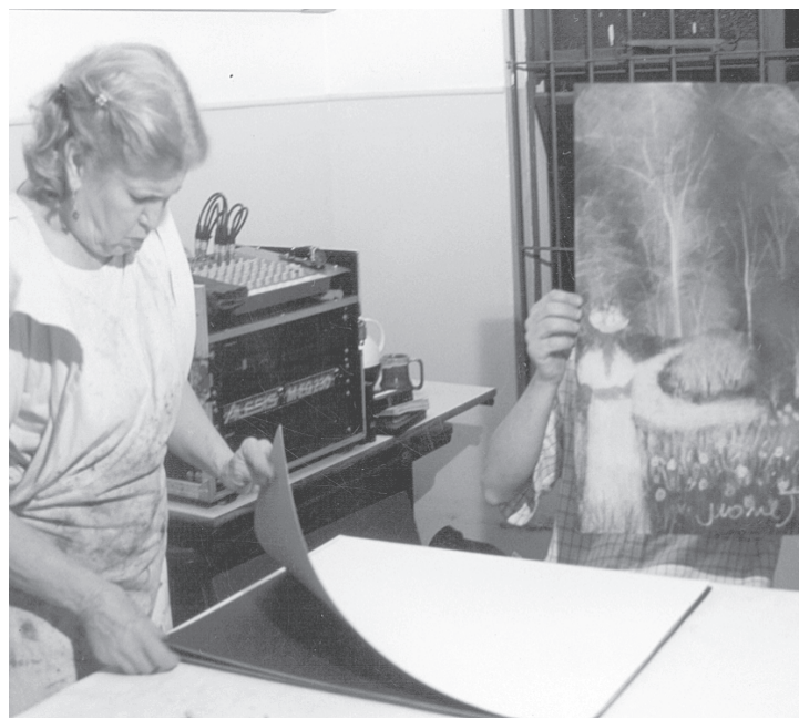
Evangelização feita, através das cores

— Mesmo que eu fosse artista, e eu não sou, eu não conseguiria imitar todos esses artistas, porque eu iria, interferir com a minha própria individualidade. Meu trabalho é um trabalho sério, com uma finalidade filantrópica. Quero ajudar as pessoas.