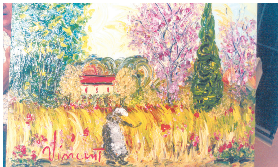
Pintura médiúica feita em 7/12/01 (Vincent Van Gogh)