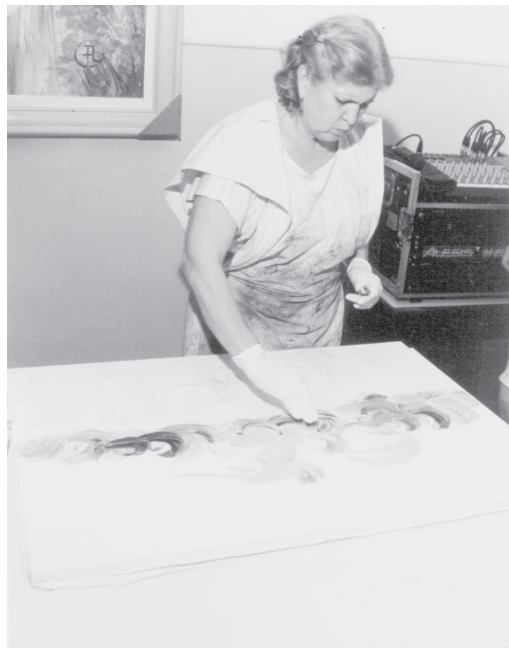
Pintura Mediúnic (7/12/01)