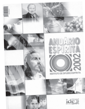
leitura indispensável para todos que desejam estar atualizados com as notícias do movimento espírita.

IDE - Instituto de Difusão Espírita - Tel.: (19) 541-0077 - Fax: (19) 541-0966