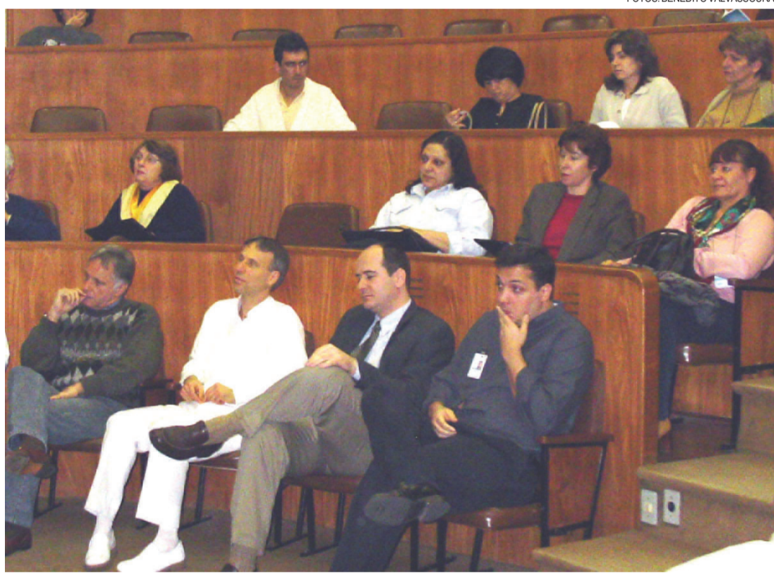
Médicos e profissionais da Saúde discutem espiritualidade no HC

Aproximadamente 90 pessoas, entre médicos, psicólogos, fisioterapeutas e outros profissionais da área médica, estiveram presentes em mais uma etapa da 1ª Jornada Religião e Prática Médica, que