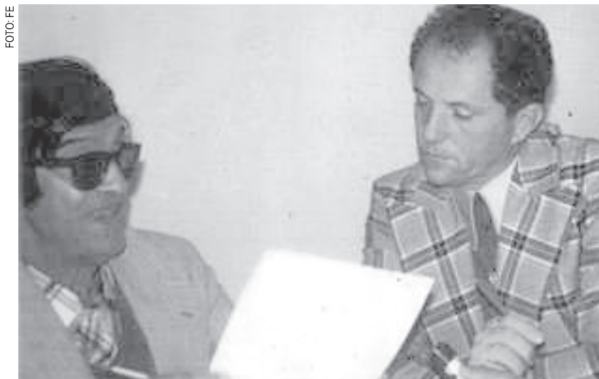
Mãos de luz

Ainda em convalescença, depois de ter ficado no hospital, lembrei-me de algumas horas que convivi com Gasparetto, médium que pinta só com a ponta dos dedos dos pés e das mãos, quando presenciei o que o povo chama de milagre. Vou agora reproduzir o que, na madrugada daquele dia, registrei em meu caderno de anotações.