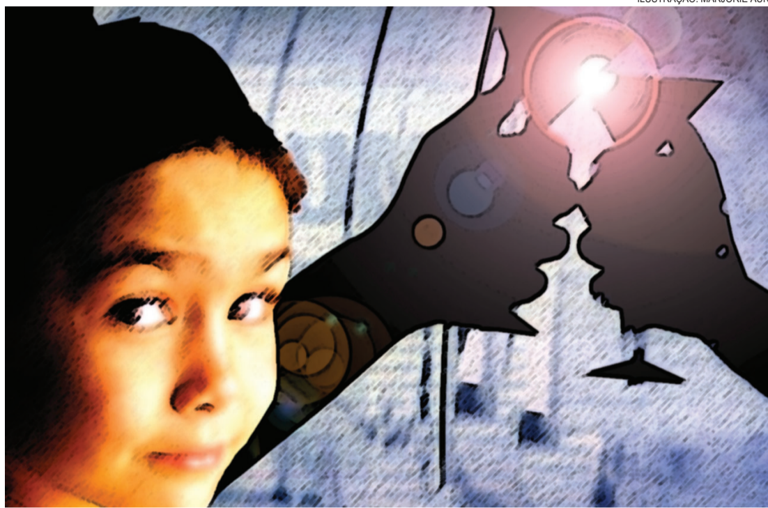
ILUSTRAÇÃO: MARJORIE AUN